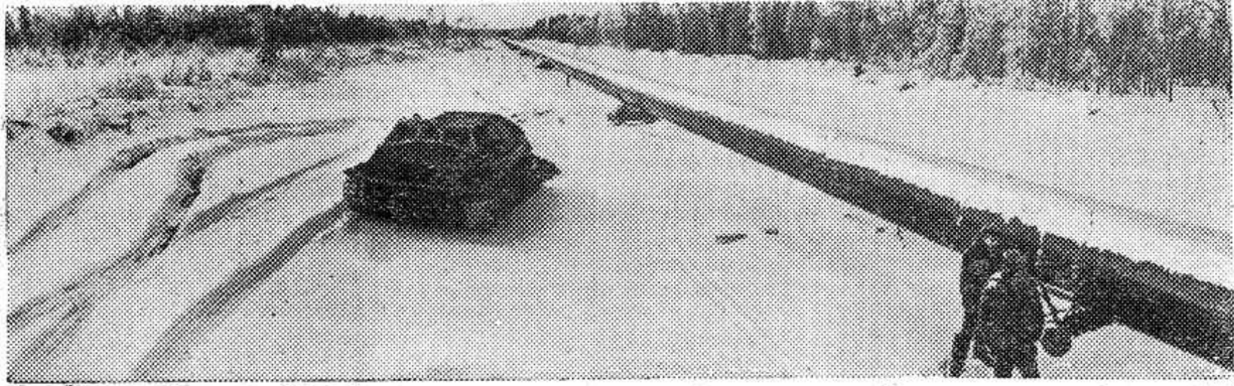
КОМИ АССР. Богаты подземные кладовые Вуктыльского газоконденсатного месторождения,