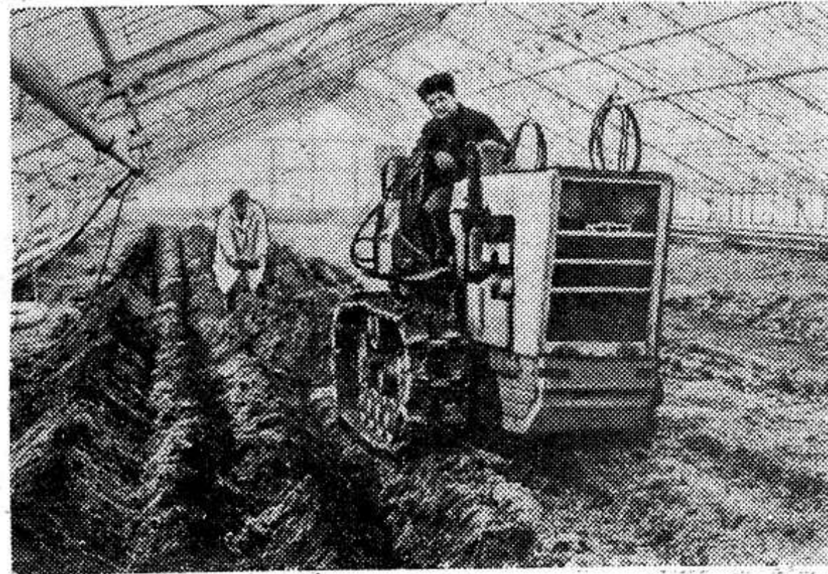
Московская область. На тепличном комбинате совхоза имени Горького, занимающем 24 гектара, с каждого квадратного метра закрытого грунта решено получить по 34 килограмма овощей. Здесь выращивают 24 сельскохозяйственных культуры. Чистая прибыль от реализации продукции составит в четвертом году