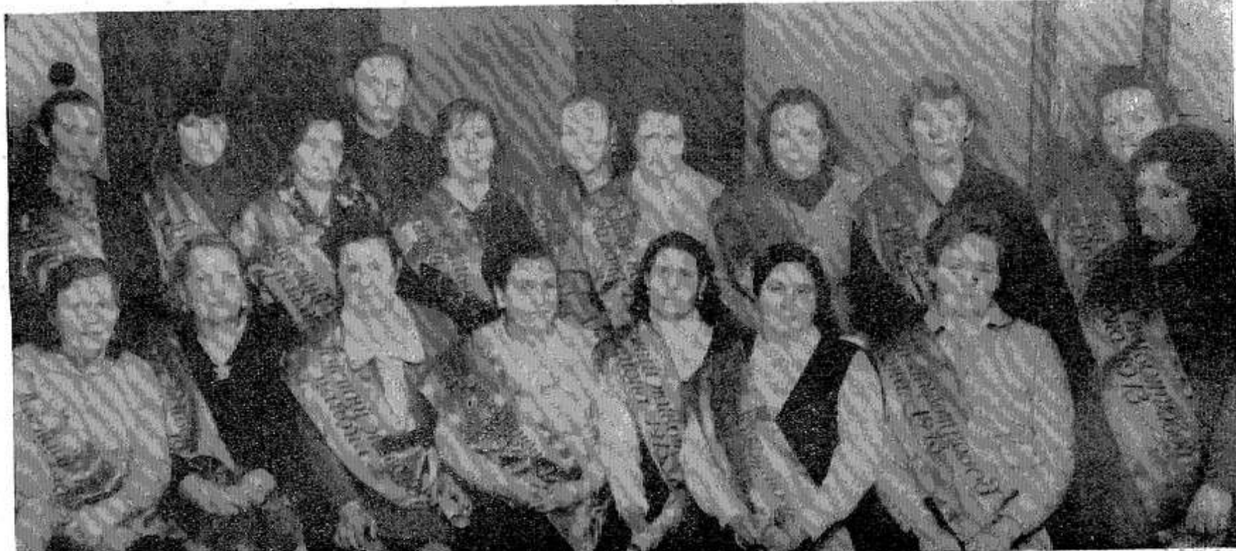
НА СНИМКЕ: участники съезда, которым присвоено звание «Лучший животновод района 1973 г.»

Как и каждый советский человек, я хочу делом ответить на Обращение ЦК КПСС. Мое личное обязательство на четвертый год пятилетки таково: собрать с каждого хозяйства, имеющего в личном пользовании корову, по 2200 килограммов молока.