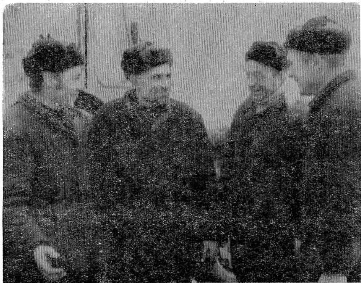
НА СНИМКАХ: механизаторы отряда плодородия обсуждают итоги очередного дня; внизу — идет погрузка удобрений.

В борьбе за урожайную ниву каждый из них стремится сегодня сделать больше, чем вчера, а завтра — больше, чем сегодня.