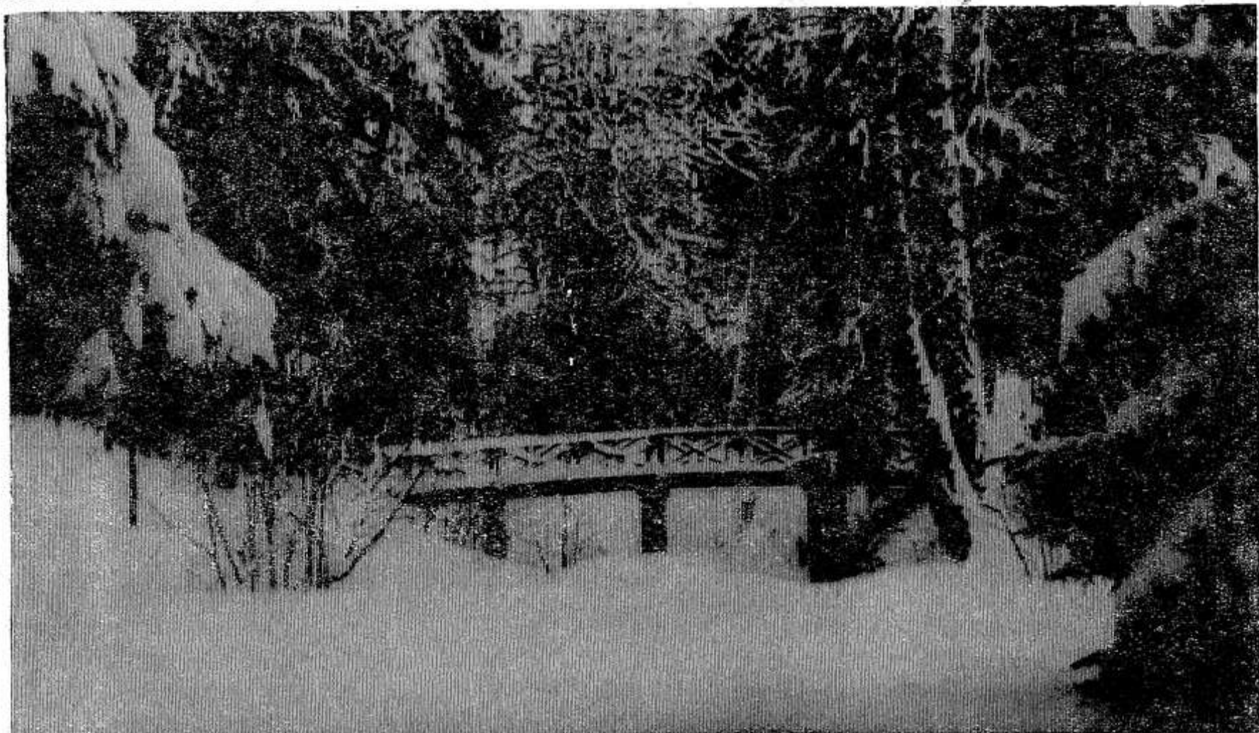
В Михайловском парке.