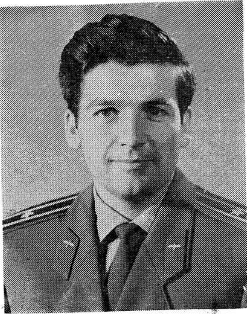
Командир космического корабля «Союз-13» ПЕТР ИЛЬИЧ КЛИМУК.