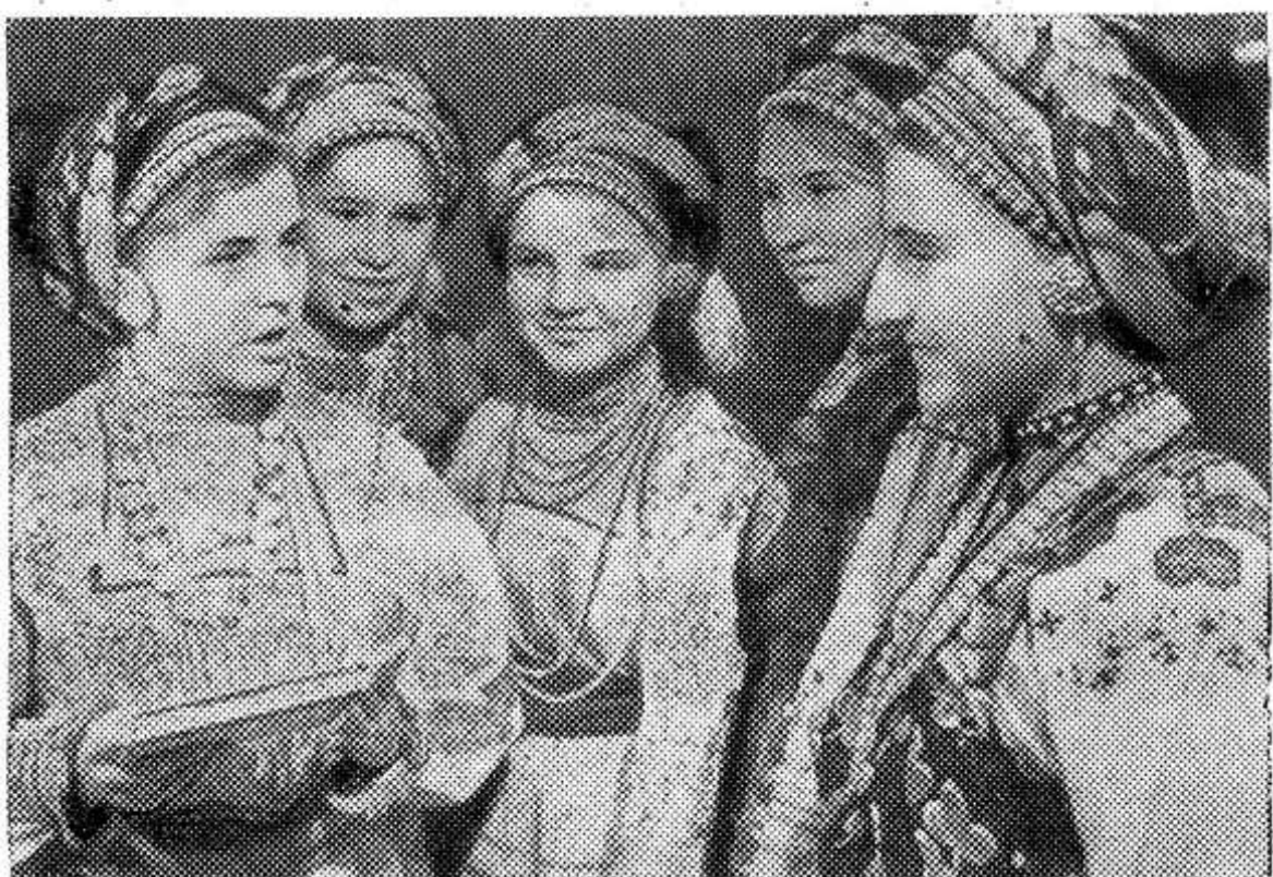
«Граждане СССР имеют право на образование». (Из Конституции СССР)

Мордовская АССР. В Мордовском государственном университете имени Огарева учатся около 400 колхозных и совхозных стипендиатов. После окончания вуза молодые специалисты возвратятся в родные села, возглавят важнейшие участки производства, будут работать в сель-