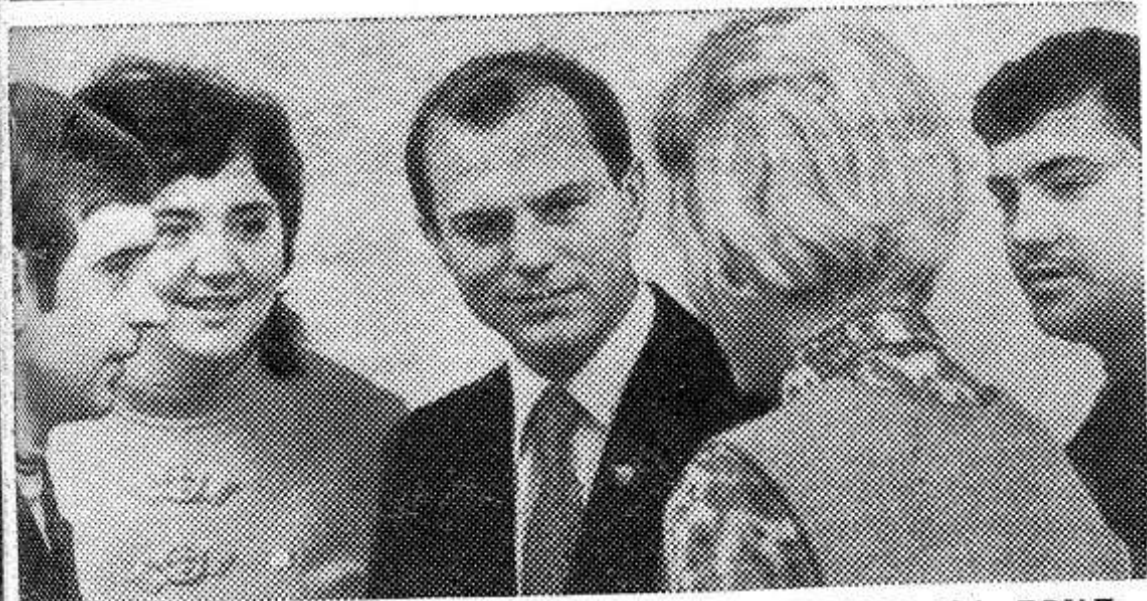
«ГРАЖДАНЕ СССР ИМЕЮТ ПРАВО НА ТРУД». (Из Конституции СССР).

В Конституции СССР закреплены великие завоевания нашего народа, впервые в мире построенного социалистического общества, воплощены принципы социалистической демократии. Экономическое, социальное и политическое раскрепощение народных масс, братство народов, равноправие людей труда провозглашены и гарантированы Конституцией Страны Советов. Развивая инициативу рабочих, колхозников, интеллигенции в государственном строительстве, партия повышает роль и авторитет Советов, профсоюзов, Ленинского комсомола и других общественных организаций. Самый многочисленный класс нашего общества — рабочий класс. Он насчитывает в своих