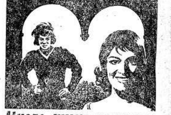
Много шума из ничего

История жизни таджикского просветителя XIX века Ахмада Донниша — философа и поэта, историка и дипломата, борца за прогресс и справедливость.