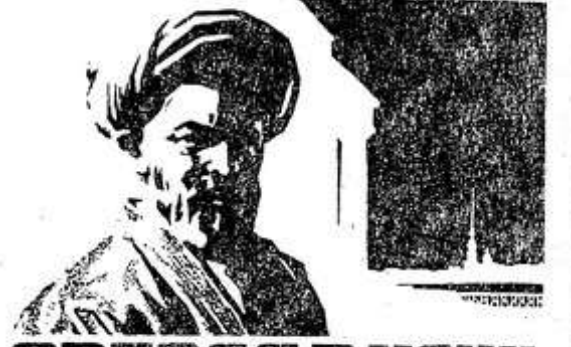
ЗВЕЗДА В НОЧИ

Приключенческий фильм, действие которого происходит в 1919 году в Крыму.