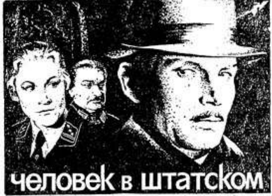
ЧЕЛОВЕК В ШТАТКОМ

Фильм этот посвящается людям, стоящим на страже закона — работникам милиции и прокуратуры. В основе его лежат реальные события. Основная мысль фильма в том, что жизнь и имущество советских граждан находится под защитой опытных, бдительных работников юстиции, которые с помощью самой современной техники раскрывают любые преступления. И как бы разрушитель закона ни заметал следы, ему не уйти от возмездия.