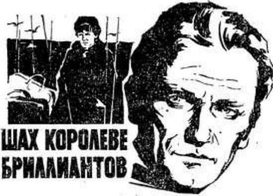
ШАХ КОРОЛЕВЕ БРИЛЛИАНТОВ