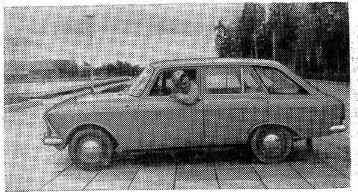
Удмуртская АССР. На Ижевском автозаводе началось производство новой модели легкового автомобиля — «ИЖ-комби». Эта элегантная, комфортабельная машина, в которой предусмотрена максимальная унификация узлов и деталей с базовой моделью — «Москвичом - 412», несомненно, заинтересует автолюбителей. Благодаря пятой двери, находящейся на задней стенке кузова, машину можно легко и быстро превратить в грузо-пассажирскую. На дорогах страны уже появились первые «ИЖ-комби». НА СНИМКЕ: новый автомобиль «ИЖ-комби».