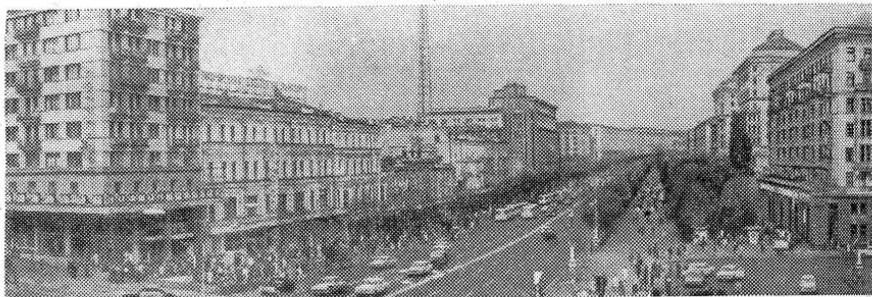
Киев сегодня. Крещатик.