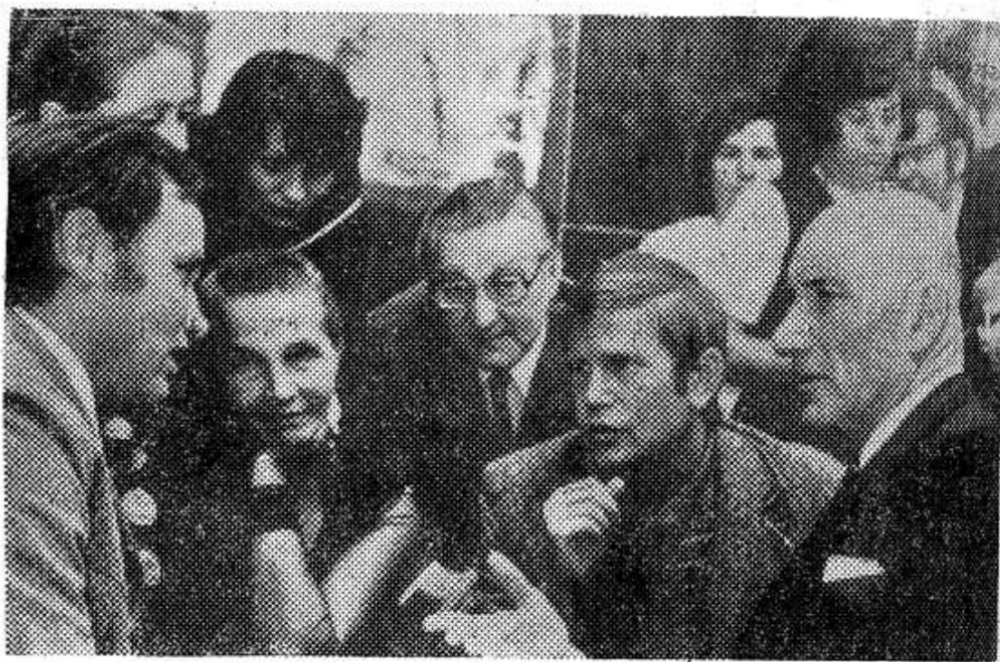
Фильмы Советского Союза с успехом идут на экранах Германской Демократической Республики. Недавно жители Магдебурга познакомились с новым для них произведением советского киноискусства «Любить человека», показанным в рамках проводившихся

в этом городе «Дней социалистического кино».