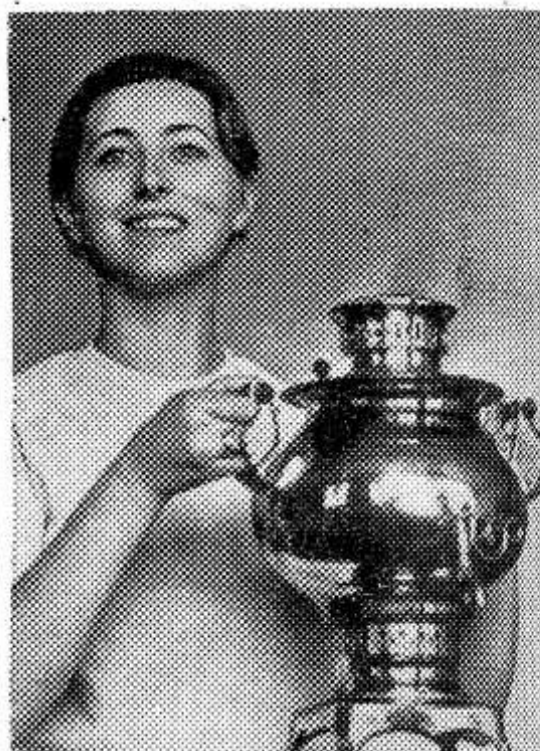
Более двадцати агрегатов, облегчающих труд в быту, разработал в этом году коллектив Львовского центрального конструкторского технологического бюро электроприборов. Экспериментальные образцы их уже изготовлены. Вскоре новинки будут выпускаться различными предприятиями страны.

НА СНИМКЕ: электросамовар с термоограничителем. Его емкость 2,5 литра. Мощный нагревательный элемент позволяет за 10 минут вскипятить чай.