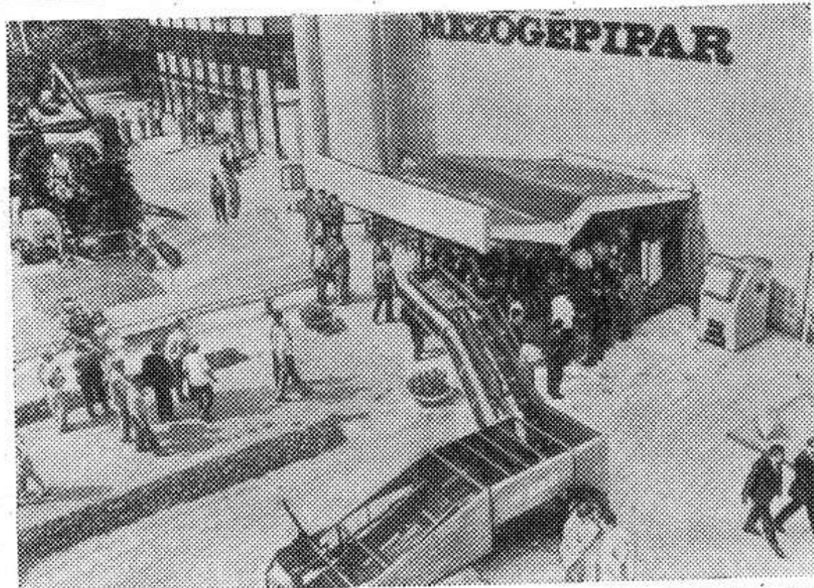
ВНР. В Будапеште на большой международной выставке «Агротех-73» (на снимке) 18 стран продемонстрировали достижения в области автоматизации сельского хозяйства, лесной, пищевой промышленности и дорожного строительства. Центральное

место в экспозиции занимали павильоны социалистических стран — членов СЭВ. Жюри выставки удостоило четырех золотых медалей машины советского производства.