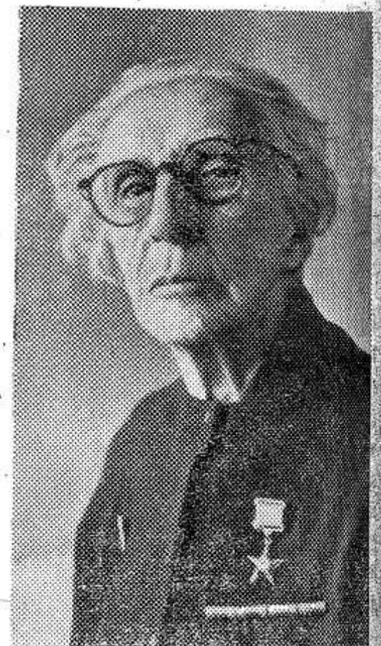
Е. Д. Стасова награждена пятью орденами Ленина, в 1960 году ей присвоено звание Героя Социалистического Труда.

15 октября исполняется 100 лет со дня рождения Елены Дмитриевны Стасовой (1873—1966).