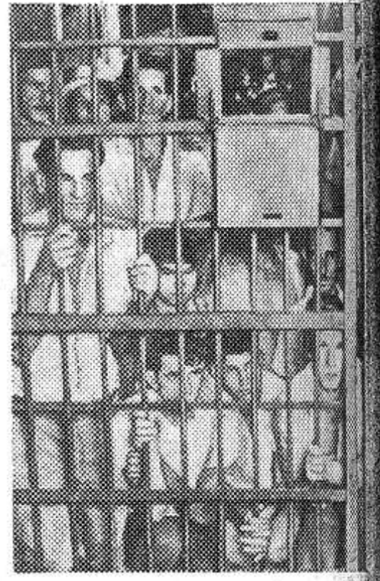
Коста-Рика. Крестьянские семьи провинции Алахуэла захватили пустующие помещичьи земли и приступили к их обработке. На место происшествия прибыла полиция. На требование оставить захваченные земли и выдать руководителей крестьяне ответили отказом. Произвошли столкновения, многие участники которых были арестованы полицией. На снимке: арестованные крестьяне за решеткой.