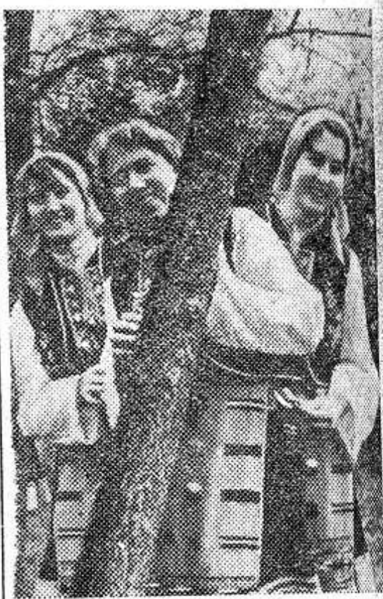
БОЛГАРИЯ. За послевоенные годы село Инзово Ямболовского округа коренным образом изменилось. У каждого жителя села отдельный дом. В комнатах телевизоры, радиоприемники, холодильники, добротная мебель. На широких мощеных улицах построены Дом культуры, кинотеатр, ясли и детские сады, магазины. Широко развита художественная самодеятельность.

Н. КРАСНИКОВ, кандидат исторических наук.