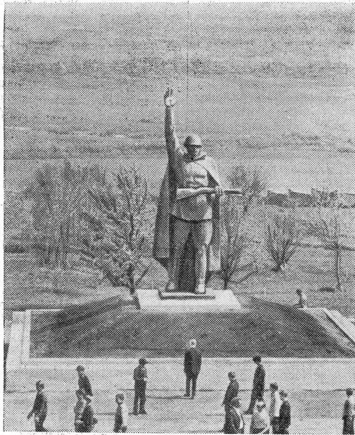
Монумент воина-победителя, установленный в Свободинском мемориале-музее Курской битвы.

(к 30-летию начала сражения 5 июля 1943 г.)