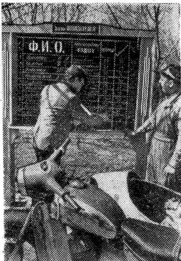
Украинская ССР. Земледельцы колхоза имени Суворова Татарбунарского района Одесской области в третьем, решающем году девятой пятилетки обязались собрать с каждого из 2500 гектаров по 34,2 центнера зерна, — на четыре центнера больше, чем в прошлом году.