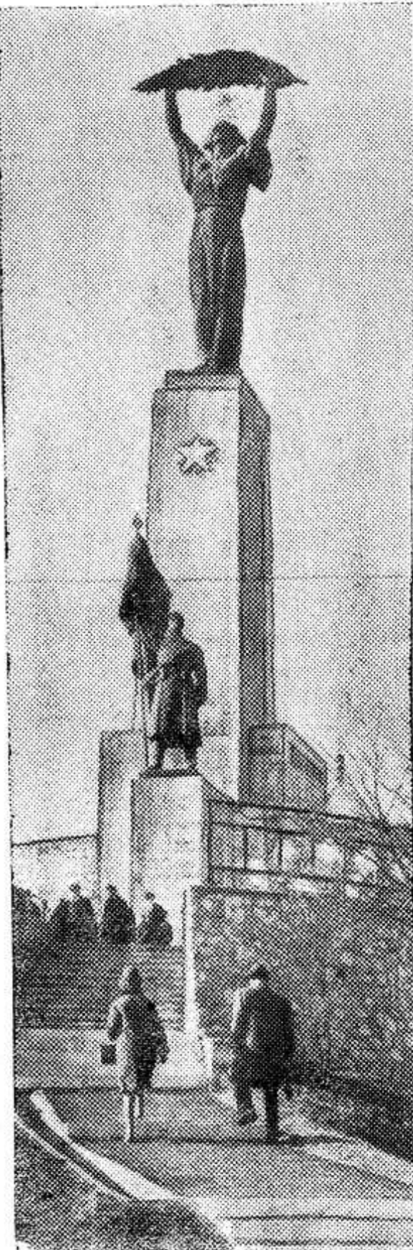
У монумента Освобождения на горе Геллерт в Будапеште. На его цоколе вырезаны имена советских героев, отдавших свою жизнь в боях за венгерскую столицу.