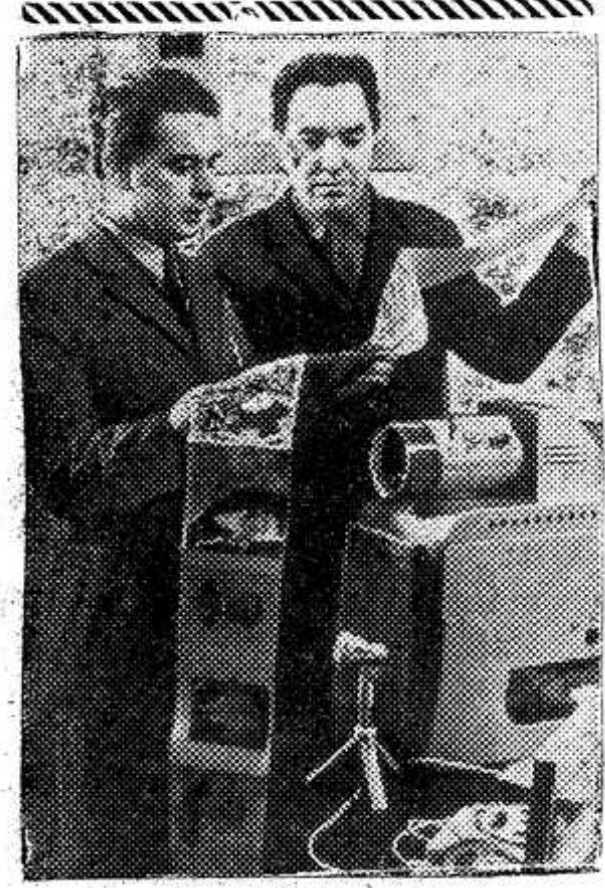
С каждым годом крепнет дружба колхозников русского села Октябрьское и башкирского села Мурапталово.

Товарищеская взаимопомощь здесь — одно из важнейших условий социалистического соревнования. Оренбургские колхозники помогли своим башкирским друзьям освоить технологию выращивания подсолнечника, научили их рационально вести птицеводство, передали семена урожайного сорта проса «оренбургское-42». Колхозники из села Мурапталово не остались в долгу — на практике показали оренбуржцам, как выращивать высокие урожаи сахарной свеклы, поделились опытом строительства производственных и культурно-бытовых зданий, помогают соседям в перевозке различных грузов.