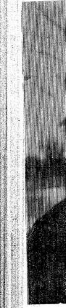
Ольга Г. туюру вы трудится нотоварной к коммуни но, сейчас фермы по продукция мов в ден

Доярка совхоза «Васильева в пр дой коровы по 2549 кило успешно сп