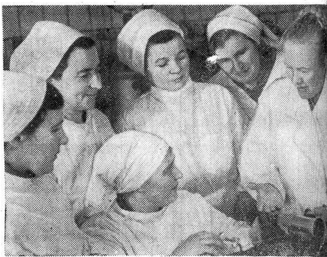
Краснодарский край. Работники ферм совхоза «Красноармейский» — инициаторы социалистического соревнования животноводов страны — с честью держат свое слово. Среднесуточные надон молока по каждой ферме почти на 45 килограммов выше, чем в зимние месяцы минувшего года. Гласность соревнования, широкое распространение передового опыта, помощь отстающим — залог успеха.