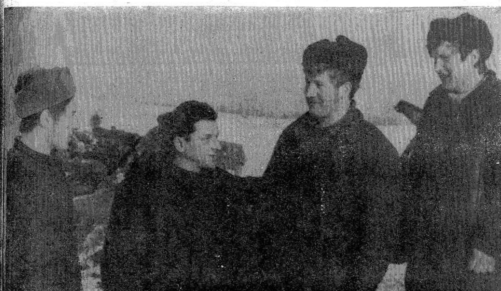
В совхозе «Духновский» работает механизированное звено, в составе которого пять тракторов

До конца трехмесячника осталось совсем немного времени. Поэтому сейчас надо на этих работах сосредоточить тракторы, автомашины, конный транспорт. Работу по накоплению удобрений не следует откладывать ни на один день, ни на один час. Людей, занятых на вывозке навоза и торфа, следует материально заинтересовать, развернуть между ними соревнование за перевыполнение заданий. За период трехмесячника на поля надо доставить свыше 140 тысяч тонн навоза и торфа. Вывезено же их меньше половины. С таким положением мириться дальше нельзя. Повышение урожайности полей немислимо без достаточного количества удобрений. Поэтому дело чести земледельцев района выполнить задание трехмесячника, добиться, чтобы каждый гектар получил полную дозу удобрений.