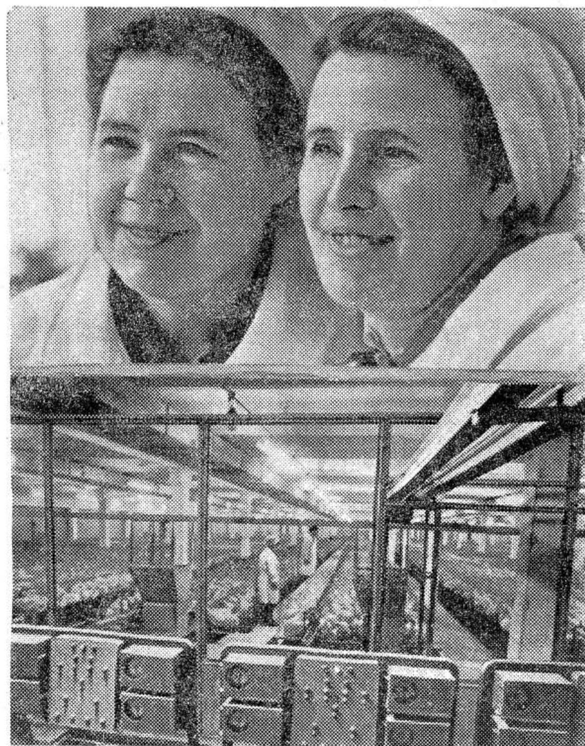
Московская область. Плодотворно начали третий, решающий год пятилетки птицеводы госплемзавсда «Коммунарка». Ежедневно в Москву и подмосковные города отправляется 52 тысячи яиц. В «Коммунарке» построен новый автоматизированный птичник. На попечении работающих

ные колонки не установлены. Заправка автомашин и тракторов производится вручную ведрами, что ведет к большим потерям горючего. Признан состояние хранения, учета и расходования нефтепродуктов неудовлетворительным, районный комитет народного контроля потребовал от правления колхоза принять меры к устранению недостатков, вскрытых в ходе проверки, а группа народного контроля должна организовать постоянный контроль за соблюдением правил хранения нефтепродуктов, сбором отработанных масел и сдачей их на регенерацию.