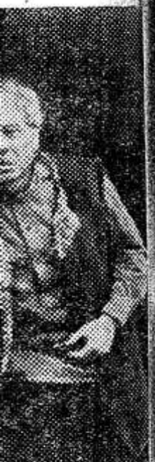
ена из спек... во: дед Ци... дный артист... планов, Юр... М. Воево... артист В. А.