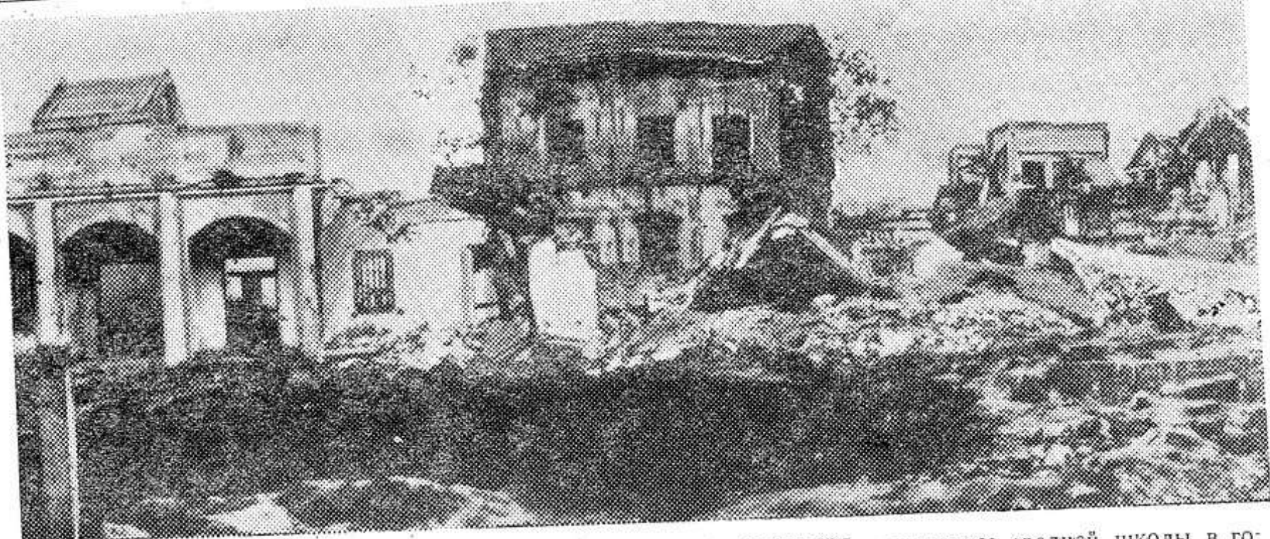
Варварские бомбардировки густонаселенных районов Демократической Республики Вьетнам американской авиацией нанесли непоправимый ущерб стране.