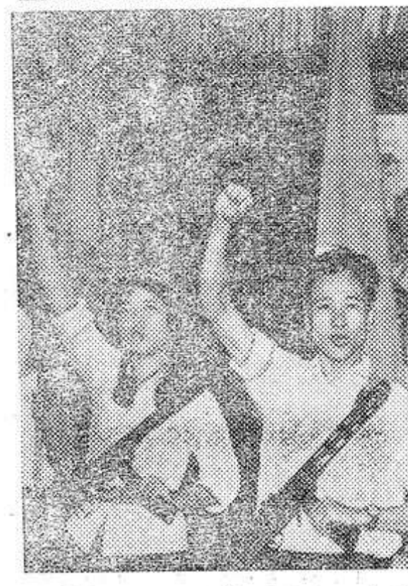
Молодежь Демократической Республики Вьетнам выражает решимость бороться до победного конца за независимость и свободу вьетнамского народа.