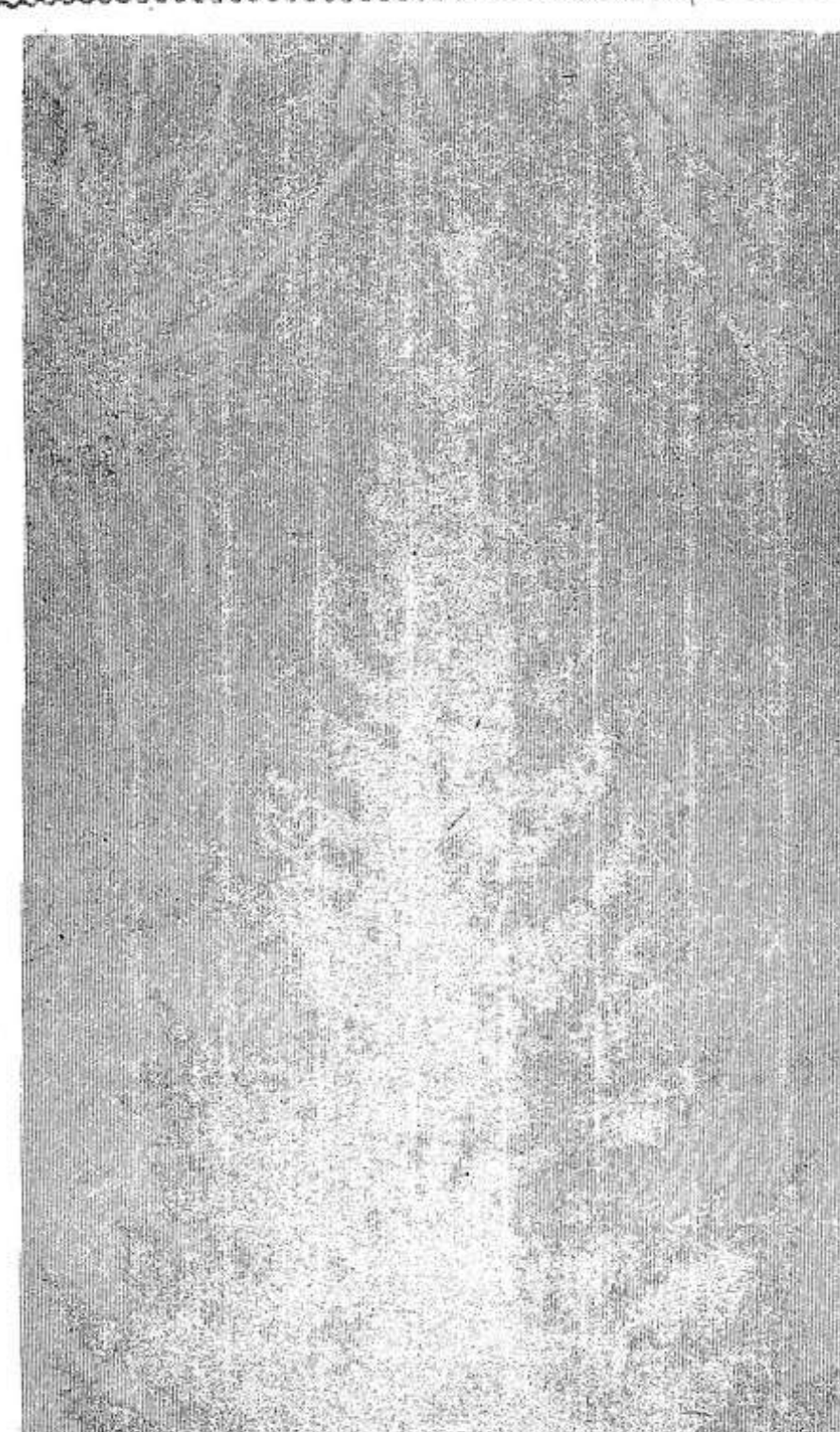
«Она на праздник к нам пришла Раскидистая и молодая».