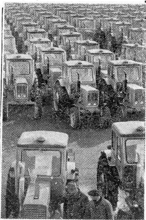
К началу весенних полевых работ 1973 года коллектив Минского тракторного завода решил изготовить сверх плана 250 тракторов, выпустить дополнительно на 500 тысяч рублей запасных частей.

Редакции районной газеты «Красный маяк» и местного радиовещания обязаны широко освещать ход Всесоюзного социалистического соревнования работников животноводства района, всесторонне пропагандировать опыт передовиков — новаторов производства.