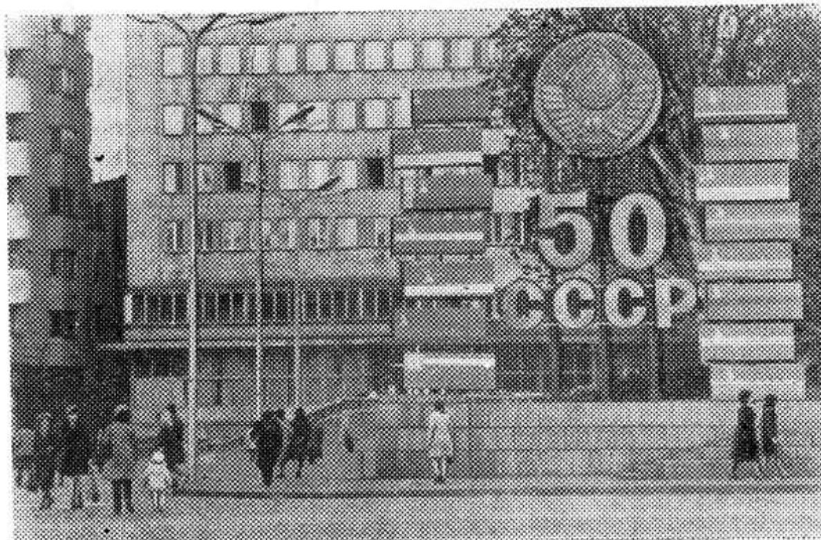
Праздничное оформление площади 9-е Сентября в Софии. Вместе с братским советским народом готовится встретить трудящиеся Народной Респуб-

лики Болгарии 50-летие образования СССР.