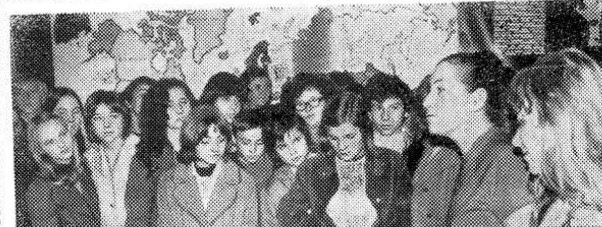
ЧЕХОСЛОВАКИЯ. В братском музее В. И. Ленина открыта новая экспозиция, посвященная 50-летию образования СССР.