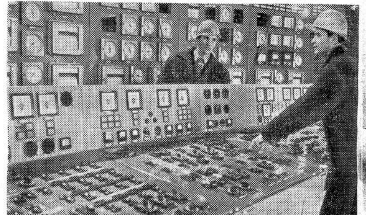
Донецкая область. Угледорская ГРЭС — пусковая стройка девятой пятилетки. Соревнуясь за достойную встречу 50-летия образования СССР, строители обязались в этом году досрочно сдать в эксплуатацию два энер-