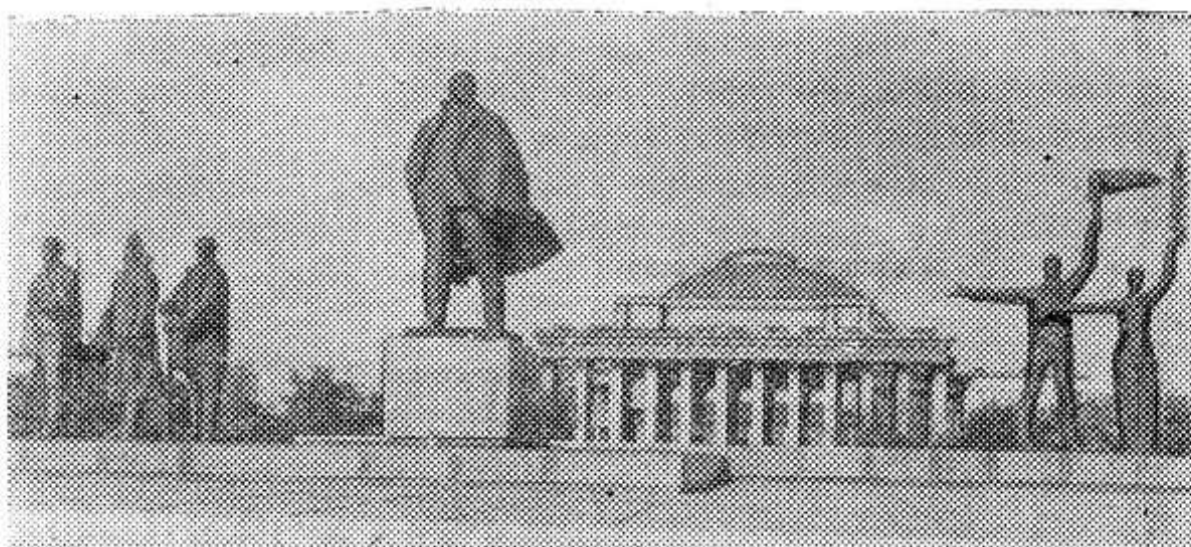
Новосибирск — крупный промышленный, научный и культурный центр страны с населением более миллиона человек. НА СНИМКЕ: Новосибирск. Памятник В. И. Ленину на площади его имени.