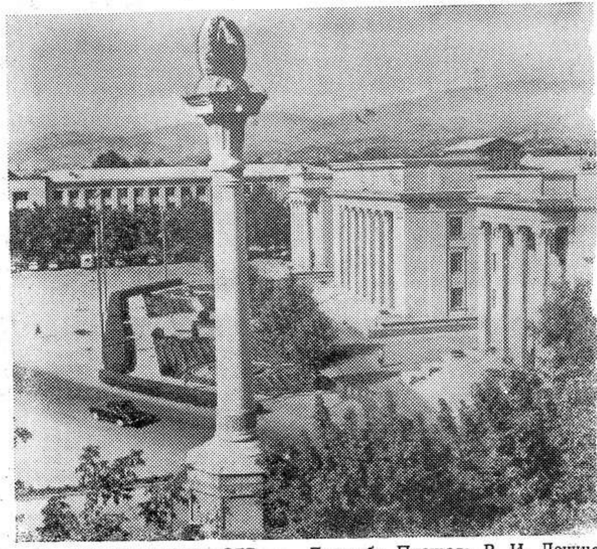
Столица Таджикской ССР — Душанбе. Площадь В. И. Ленина у Дома правительства.