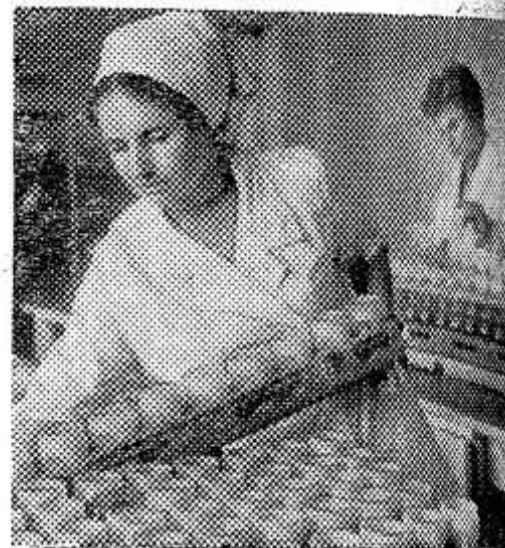
Работники Тульской областной агрохимической лаборатории приступили к анализу почв на кислотность и содержание в ней питательных веществ — калия и фосфора. На основе этих анализов составляются рекомендательные картограммы для хозяйств.