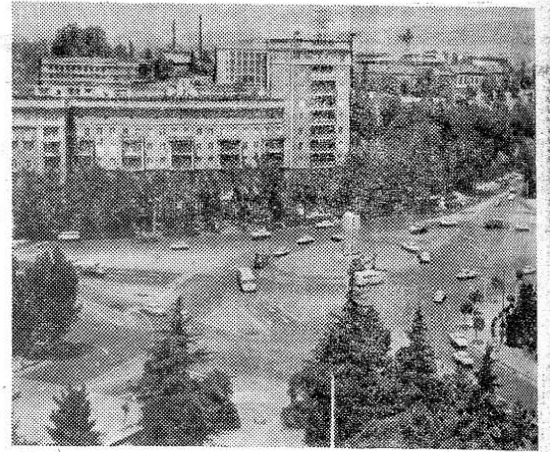
Столица Грузинской ССР — Тбилиси. Площадь Героев.