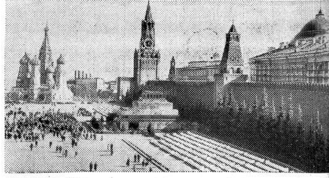
МОСКВА. Красная площадь.