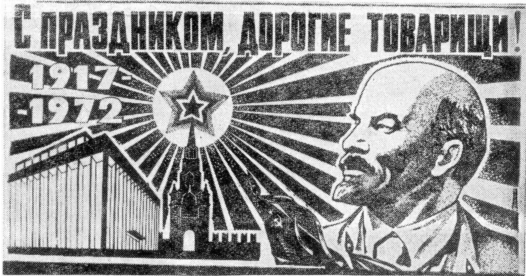
Плакат художника Э. Лукаска. (Издательство «Московская правда»).