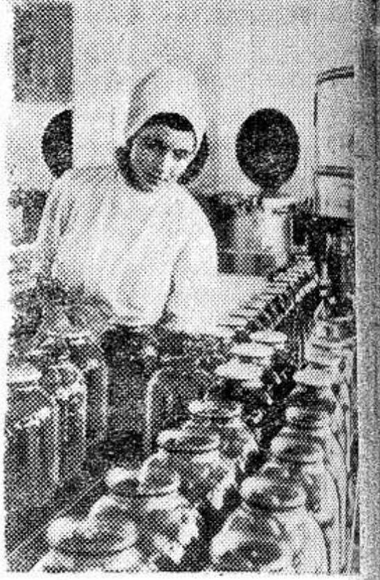
Закарпатская область. В колхозе «Прикордонник» Хустского района работает консервный завод, оснащенный новым оборудованием. В этом году он даст около двух миллионов банок различных консервов: овощных салатов, маринованных помидоров и огурцов, компотов из слив, яблок и других фруктов.

С. Бушин, зав. общественным отделом по строительству и архитектуре.