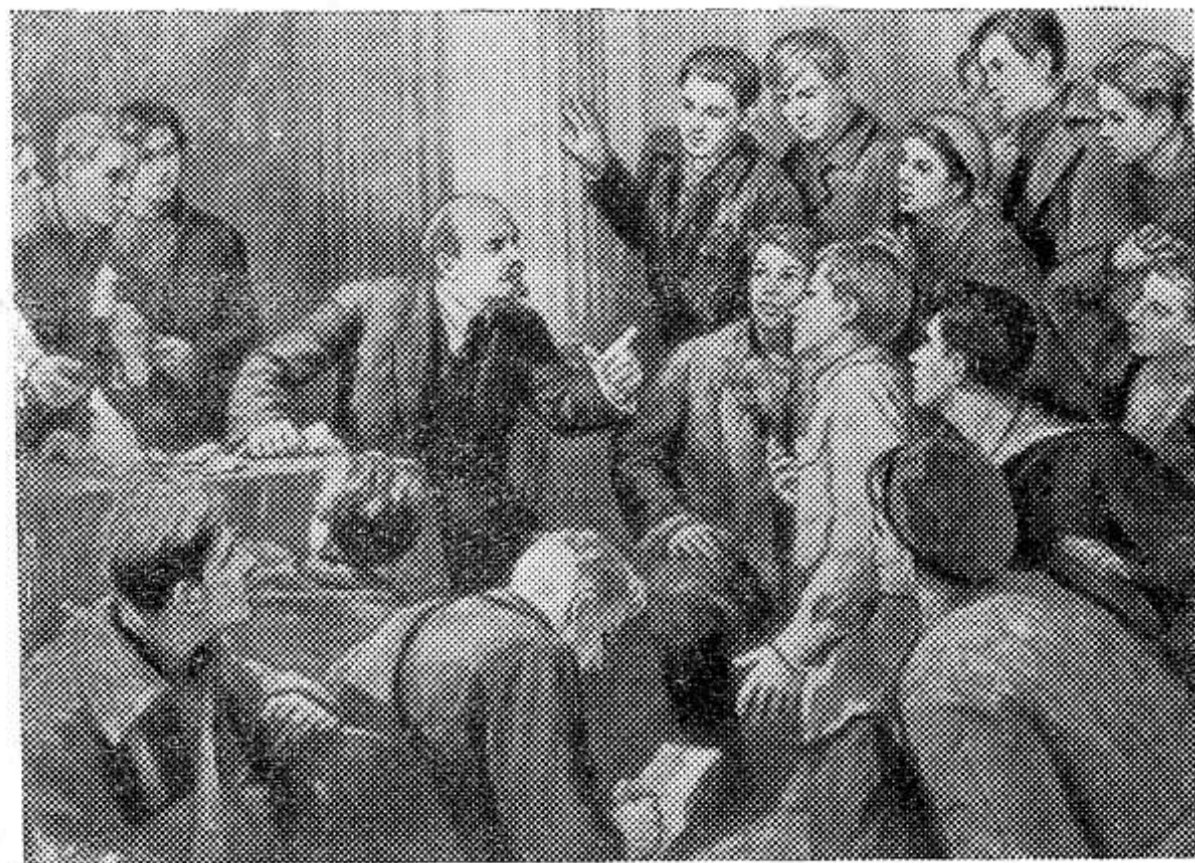
«В. И. Ленин среди делегатов III съезда РКСМ» (Картина художника П. Белоусова).

Быть всегда впереди, вести за собой остальных — вот девиз комсомольцев. Продолжая ленинскую ударную вахту, юноши и девушки района прикладывают все силы для достижения новых успехов, стараясь досрочно выполнить свои социалистические обязательства.