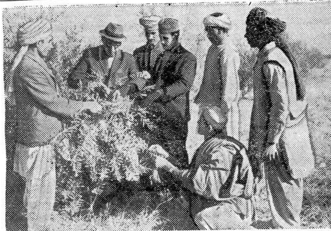
Афганистан. Государственная ферма «Хадда» — механизированное многоотраслевое хозяйство.

У входа на ферму — гранитный обелиск, воздвигнутый в честь афгано-советской дружбы. На нем высечены слова: «Ферма Хадда» построена аф-