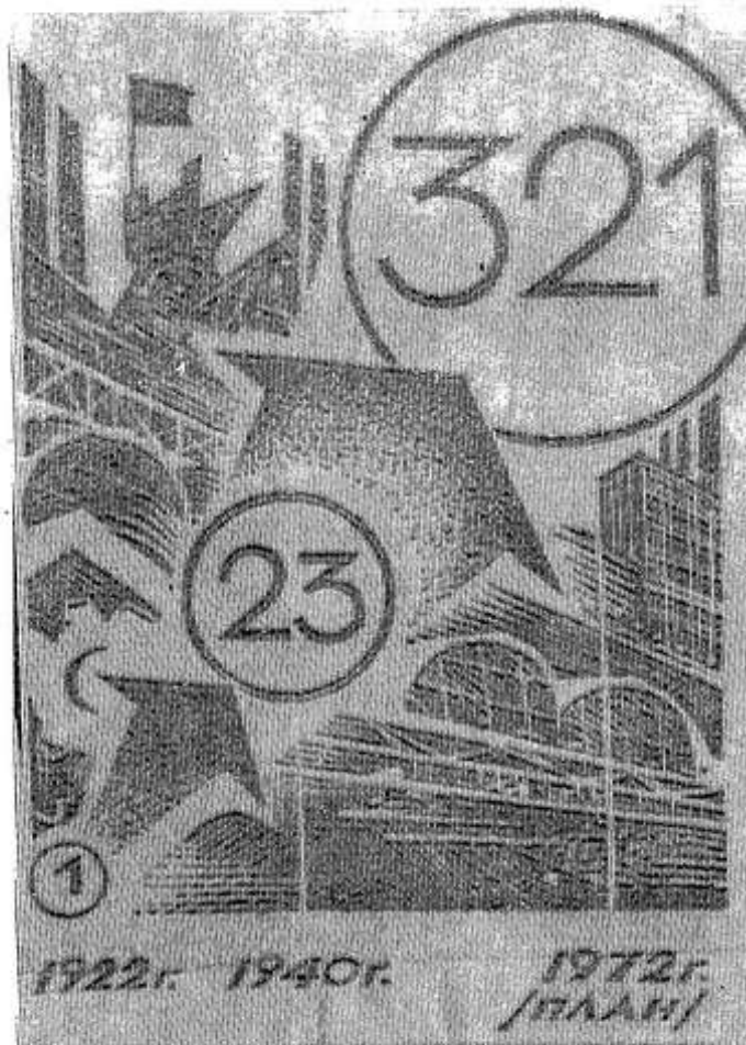
Рост продукции промышленности (1922 г. — 1).

В 1922 году длина железных дорог была 71,9 тысячи километров, сейчас она увеличилась почти в два раза и достигла 135,4 тысячи километров. Заново были созданы автомобильный, воздушный и трубопроводный транспорт. Весь объем грузооборота транспорта общего пользования в 1922 году составлял 28,2 миллиарда тонна-километров, в текущем году он достигнет огромной цифры — около 4,3 триллиона тонна-километров.