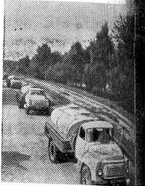
В Винницком районе Винницкой области создана специализированная автобаза областного управления молочной промышленности. Ее автомобили доставляют молоко из колхозов на молочный завод. Это позволило высвободить колхозный транспорт, многих людей. НА СНИМКЕ: молокозавод автобазы на дороге.