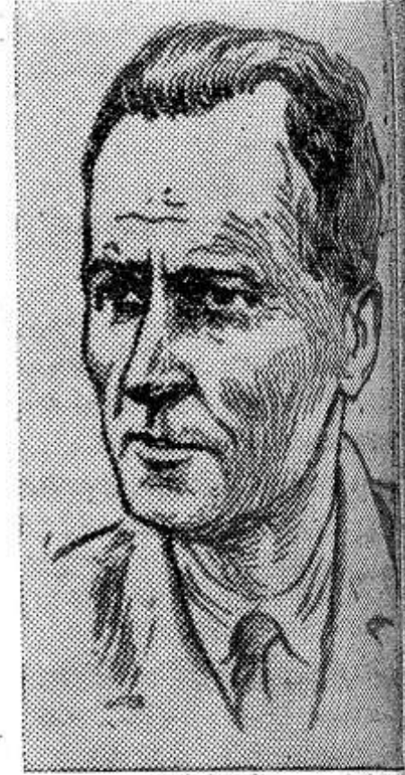
А. М. Горький. Широко известные книги Арсеньева «По Уссурийскому краю», «Дерсу Узала», «В горах Сихотэ-Алинь», «Сквозь тайгу» и др. издавались много раз.

10 сентября исполняется 100 лет со дня рождения известного исследователя Дальнего Востока Владимира Клавдиевича Арсеньева (1872—1930). Он предпринял целый ряд сложных экспедиций, посвященных изучению Дальнего Востока, природных богатств, жизни и обычаев его коренного населения. Исследовал горную область Сихотэ-Алинь, считавшуюся до того «белым пятном» на географической карте, совершил с научной целью путешествие на Камчатку и Командорские острова.