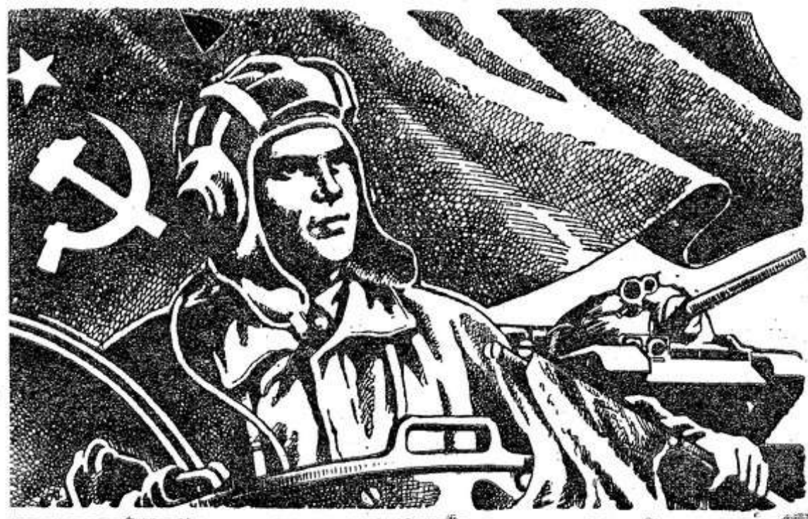
Рисунок С. Гринько.