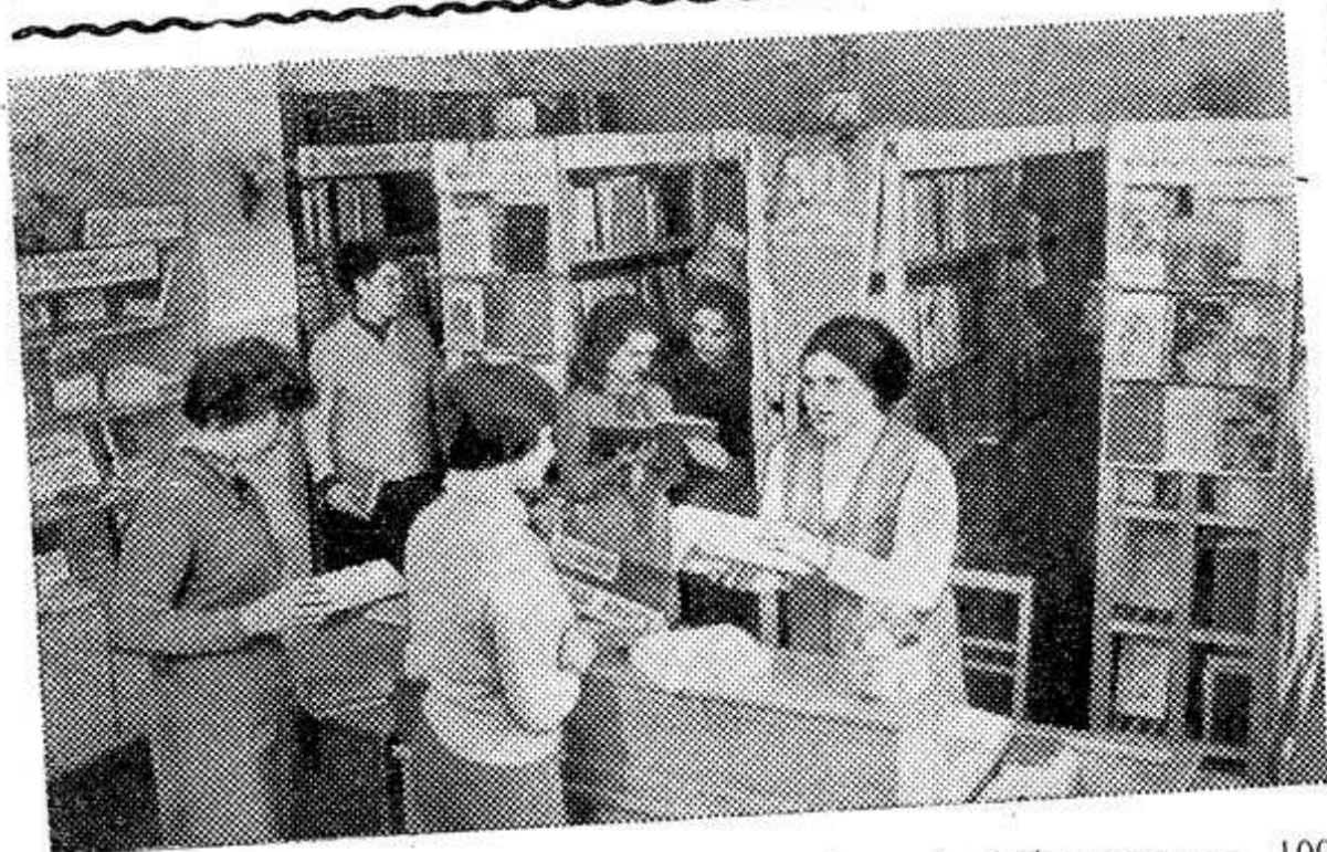
Черниговская область. Сосницкой районной библиотеке — 100 лет. Ее фонд насчитывает 31.294 книги. В библиотеке — 3289 постоянных читателей. Здесь регулярно проводятся обсуждения новых книг, читательские конференции.

По обсуждению пленум единогласно развернутое постановление также утвердило по обмену партийных документов.