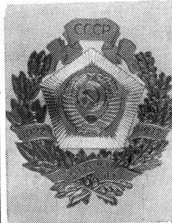
Юбилейный почетный знак ЦК КПСС, Президиума Верховного Совета СССР, Совета Министров СССР и ВЦСПС в ознаменование 50-летия образования Союза ССР.

Витаминная мука. В текущем году колхозу «Большевик» и совхозу «Красный фронтовик» предстоит продать 90 тонн витаминной травяной муки. По-государственному отнеслись к этому в колхозе «Большевик». Хозяйство завершает выполнение плана по этому виду продукции. Несколько хуже идут темпы продажи муки в совхозе «Красный фронтовик».