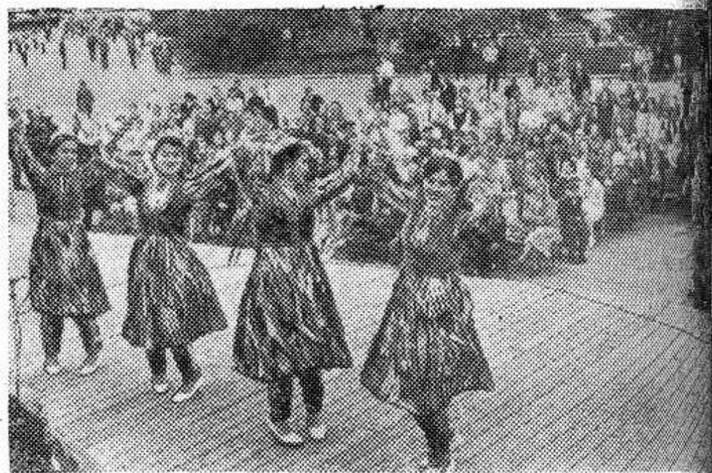
МОСКВА. У главного павильона ВДНХ СССР на открытой эстраде проходят отчетные концерты ансамблей песни и танца и народных хоров из районов разных союзных республик. НА СНИМКЕ: выступает ансамбль песни и танца «Бусло» Камашинского районного Дома культуры Кашкадарьинской области, Узбекской ССР.

В настоящее время на все фермы подвозится зеленая подкормка.