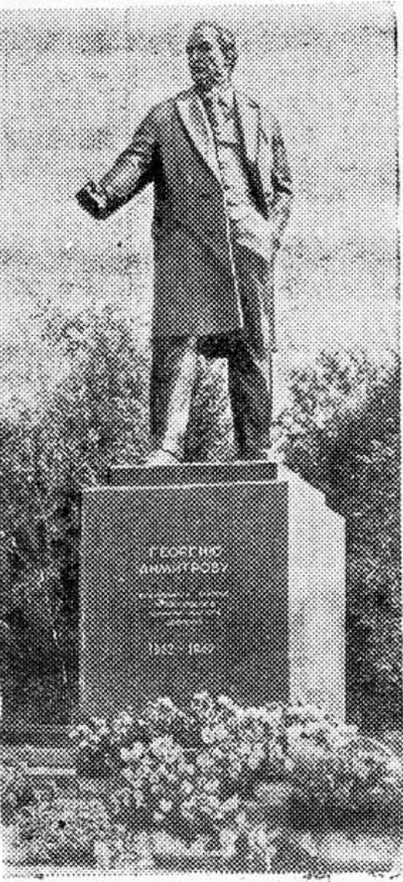
МОСКВА. Памятник Георгию Димитрову, выдающемуся деятелю международного коммунистического движения, верному сыну болгарского народа. Открыт в связи с 90-летием со дня рождения Георгия Димитрова.