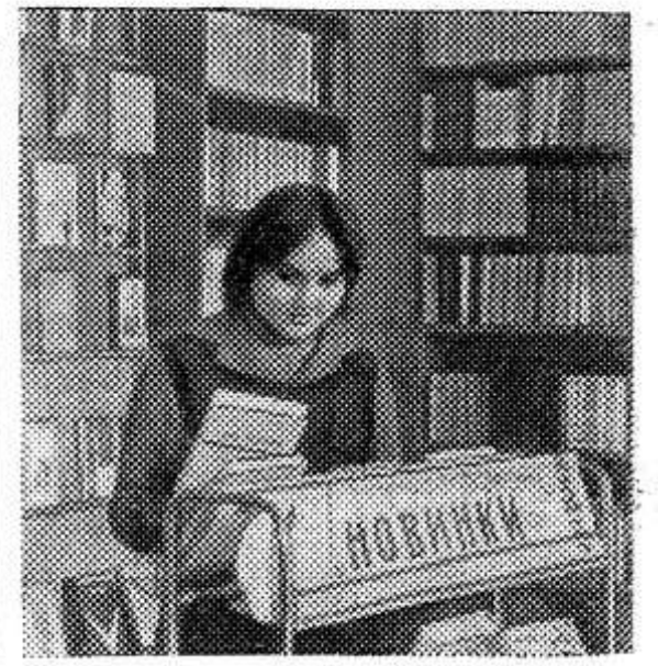
Ровенская область. Колхоз «Украина» Млиновского района ведет большое культурно-бытовое и жилищное строительство. Село украшают новые современные здания: Дворец культуры, магазины, предприятия общественного питания...