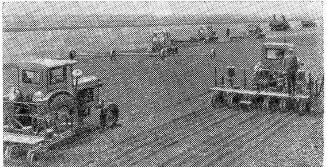
КАБАРДИНО-БАЛКАРСКАЯ АССР. В колхозе «Ленинцы» Майского района с единицы площади уже несколько лет получают по два урожая. Здесь с успехом применяют поукосные, пожнивные и озимые промежуточные посевы.

Постановления партии и правительства, направленные на борьбу с пьянством и алкоголизмом, обязывают действовать именно в этом направлении. И сейчас задача всех общественных организаций города и района внести свой вклад в организацию отдыха трудящихся.