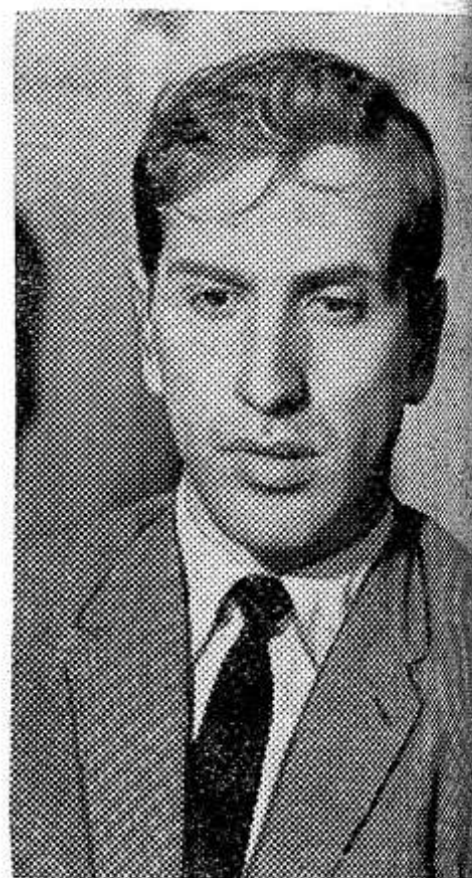
НА СНИМКЕ: Роберт Фишер.