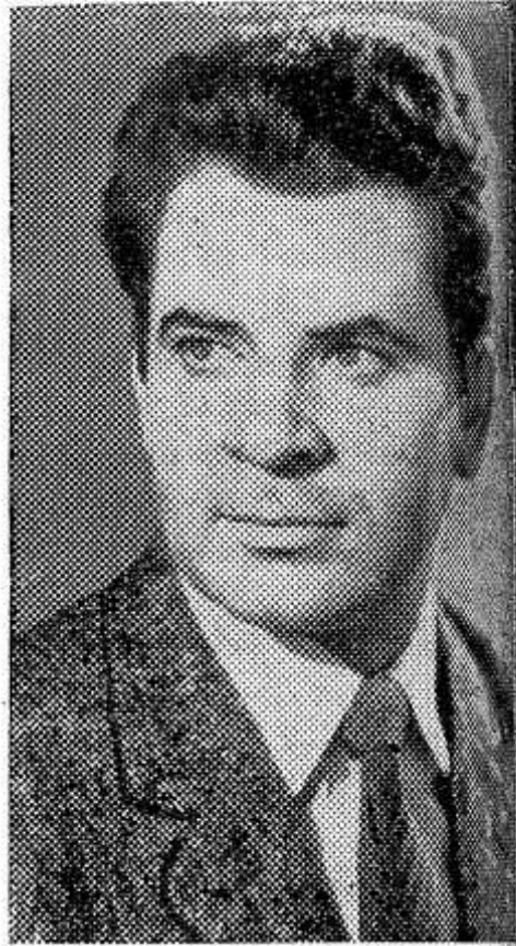
НА СНИМКЕ: Борис Спасский

2 июля в столице Исландии Рейкьявике начнется матч-первенство мира по шахматам между чемпионом мира 35-летним советским гроссмейстером Борисом Спасским и претендентом на это звание 29-летнего американским гроссмейстером Робертом Фишером. Матч состоит из 24 партий и будет продолжаться, пока один из противников не наберет 12,5 очка. Если матч закончится ничьей, Борис Спасский сохранит титул чемпиона мира.