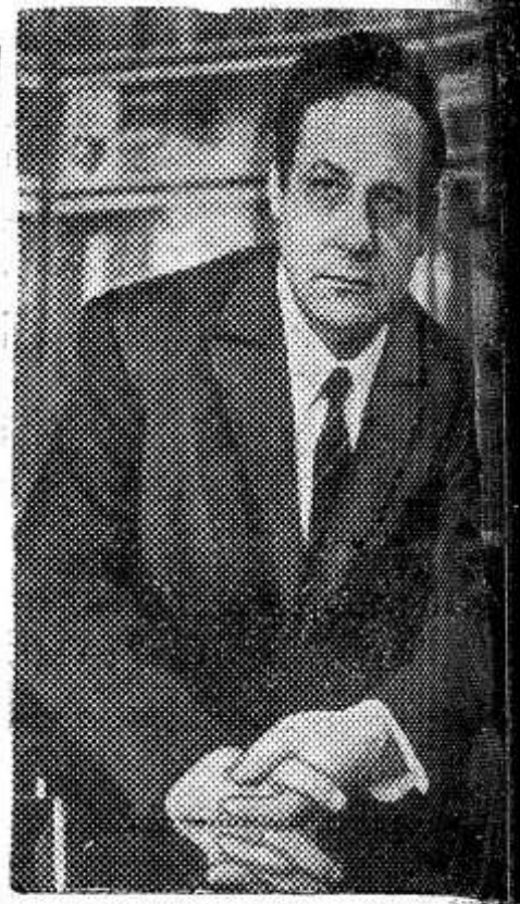
Произведения белорусского писателя Ивана Павловича лежат широко известны советскому читателю. В 1961 году вышел его роман «Люди на берегах» — широко задуманная повесть о маленькой деревне на Полесье и ее людях, партизанской и Советской деятельностью. Второй его роман «Хранить грозы» продолжает развивать судьбы героев в дни великого перелома в деревне. За эти романы И. Мелек присуждена Ленинская премия 1972 года.