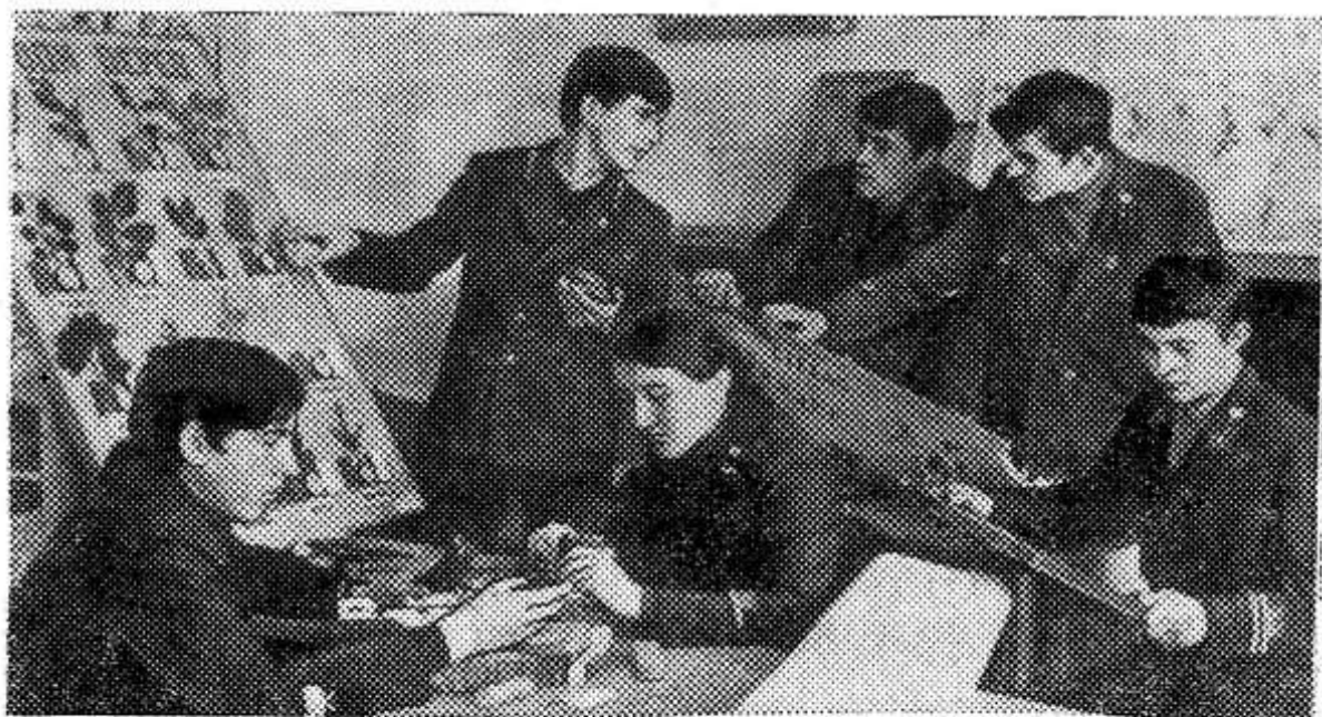
Ивано-Франковская область. В средней школе поселка Печенежин Коломыйского района есть школьное лесничество. Во владении ребят 117 гектаров леса. Юные лесоводы сооружают кормушки для ланей и куропаток, расселяют муравейники, проводят выбраковку деревьев и посадку молодняка, изготов-

К рассмотрению заявлений граждан редко привлекаются общественные организации. Слабо осуществляется контроль за организацией приема граждан на местах руководителями предприятий, организаций, колхозов, совхозов.