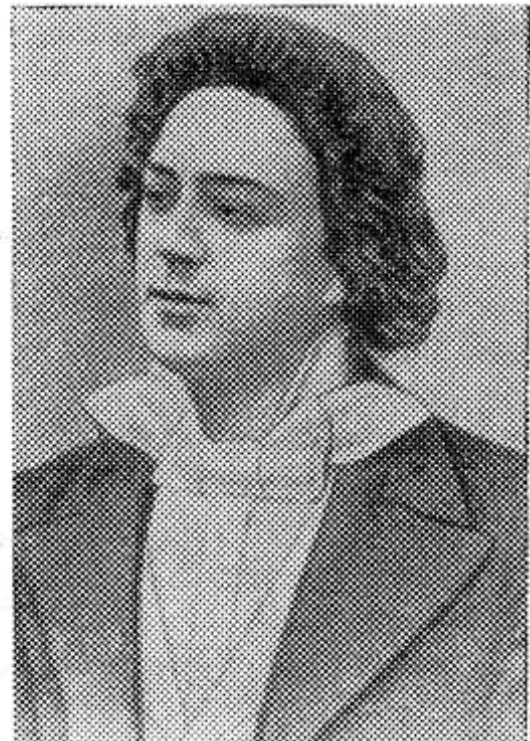
Л. В. СОБИНОВ

7 июня исполняется 100 лет со дня рождения советского певца Леонида Витальевича Собина (1872—1934).