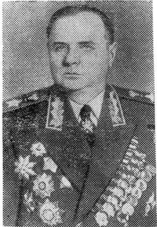
К. А. МЕРЕЦКОВ

7 июня — 75 лет со дня рождения выдающегося военного деятеля, одного из активных строителей Вооруженных Сил СССР, Героя Советского Союза Кирилла Афанасьевича Мерецкого (1897—1968).