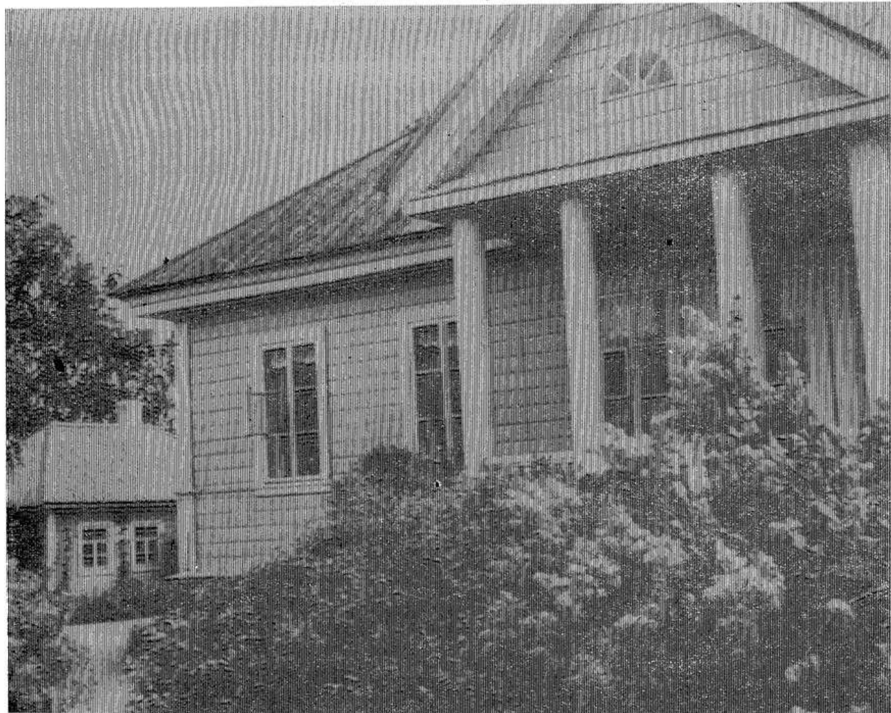
НА СНИМКЕ: Дом-музей А. С. Пушкина в Михайловском.