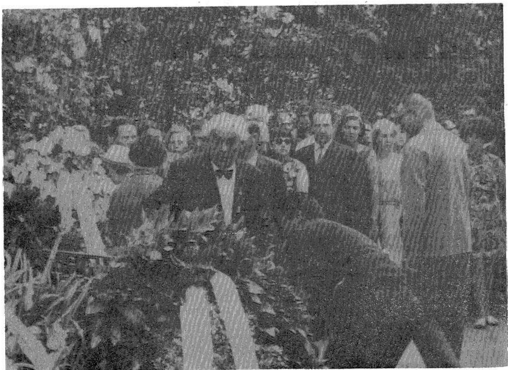
НА СНИМКЕ: возложение венков на могиле А. С. Пушкина.