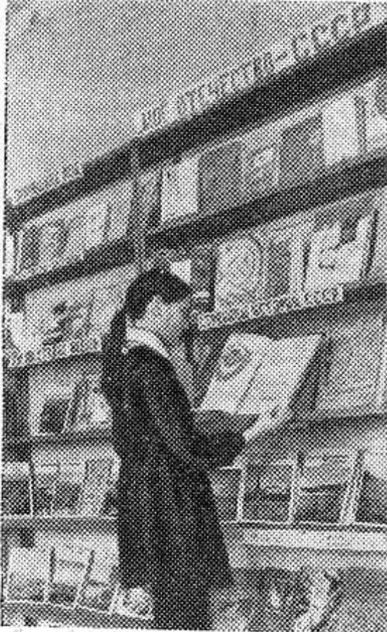
Урицкая районная детская библиотека (Орловская область) насчитывает свыше 28 тысяч книг, которыми пользуются более двух тысяч юных читателей. Здесь организуются тематические вечера, диспуты.