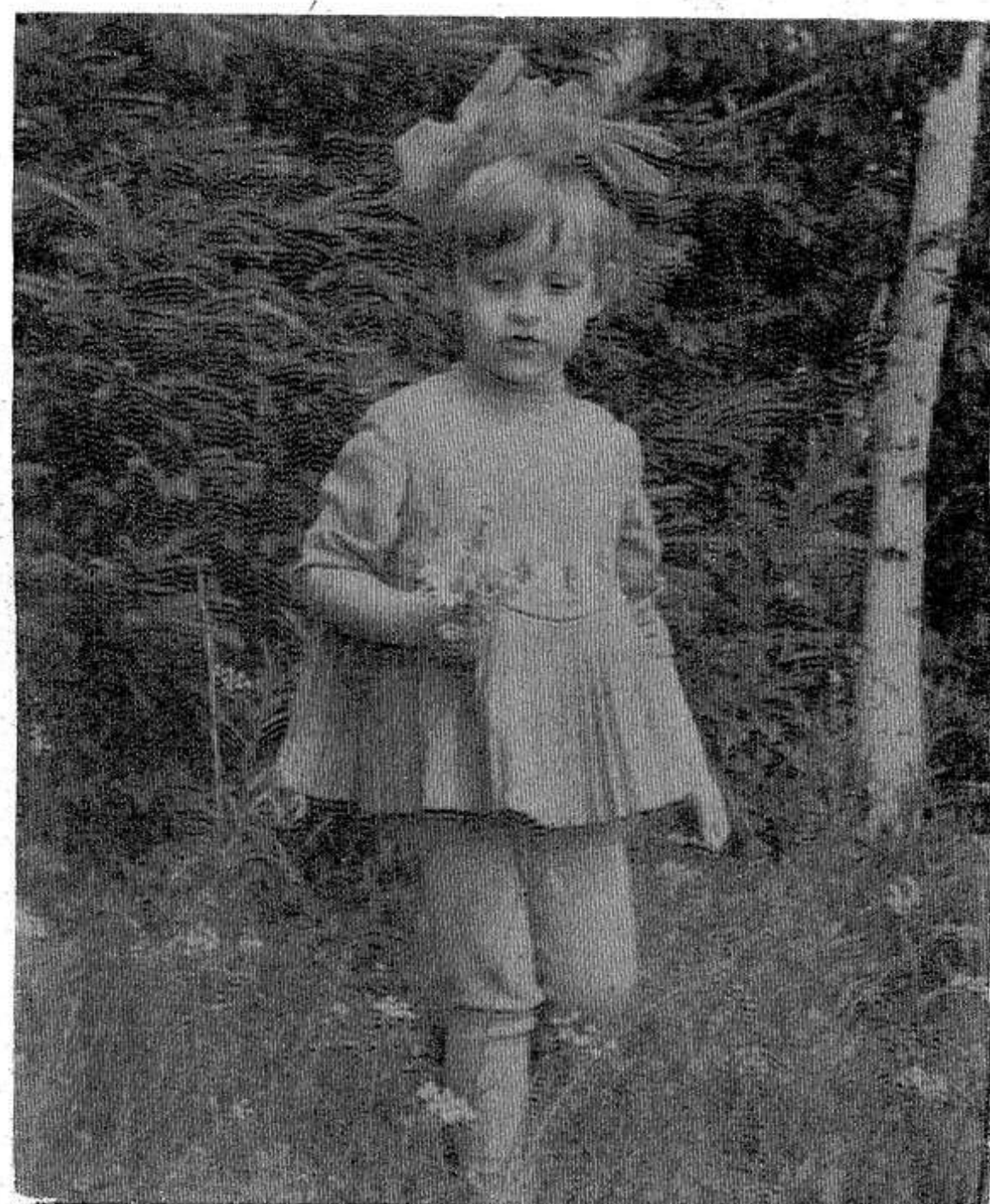
Первые весенние цветы.