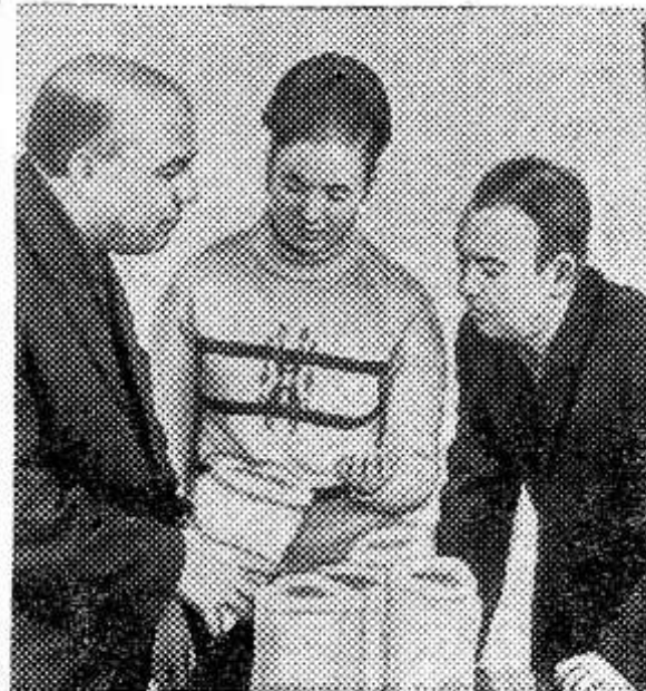
Тульская область. Колхоз «Рассвет» Богородицкого района славен хорошими урожаями сахарной свеклы. В этом году площадь под сахарной свеклой

Оно пришло на животноводческие фермы, кормокухни, сушилки, что позволило механизировать многие трудоемкие процессы. И теперь без электриков в хозяйстве как без рук.