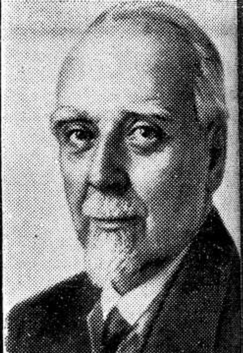
Г. М. Кржижановскому исполнилось 100 лет со дня рождения.

Всю свою жизнь известный советский государственный и партийный деятель, ученый-экономист Глеб Максимович Кржижановский (1872—1952) посвятил народу, Родине, коммунизму. Друг и соратник В. И. Ленина, он был активным участником первой русской революции. После Октября занимался электрификацией страны. По инициативе В. И. Ленина Г. М. Кржижановский в 1920 году возглавлял Комиссию по электрификации России (ГОЭЛРО) — автор ряда научных трудов в области энергетики, был президентом Академии наук СССР.