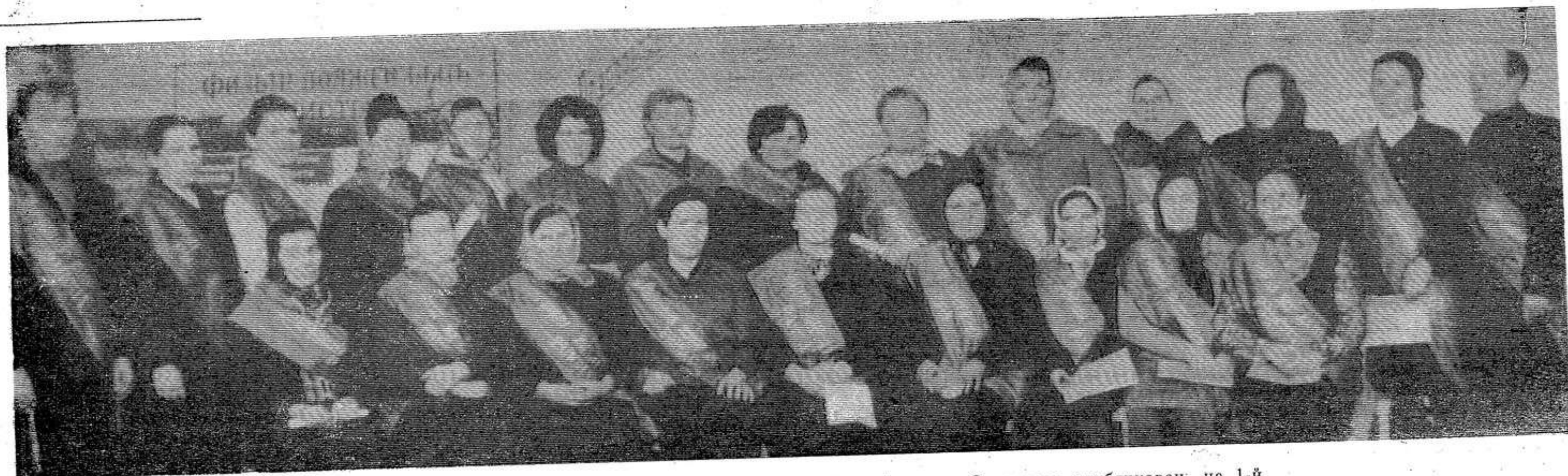
НА СНИМКЕ: работники животноводческих ферм, которым

В нынешнем году наши труженники приложат все силы для того, чтобы сработать так же хорошо, как и в минувшем.